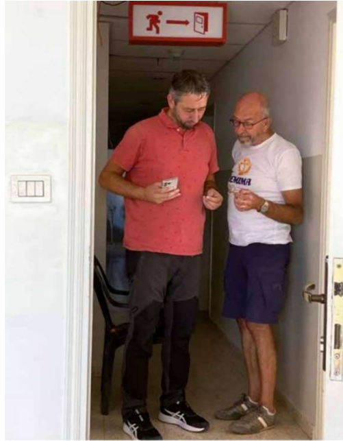
Markeringen voor vluchtwegen

In 2022 is de brandveiligheid van het gebouw Helena onderzocht en daaruit zijn enkele duidelijke verbeterpunten tevoorschijn gekomen. Deze zijn aangepakt in 2023 en er worden elk jaar ontruimingsoefeningen gehouden.